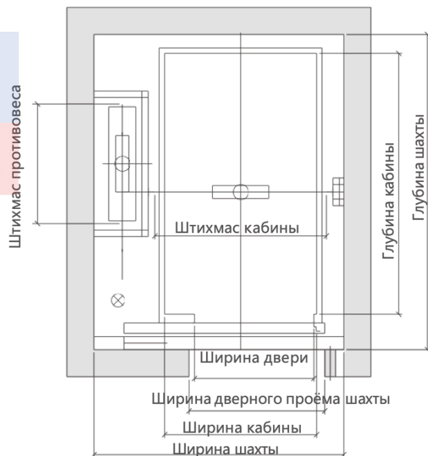
Рисунок макета шахты